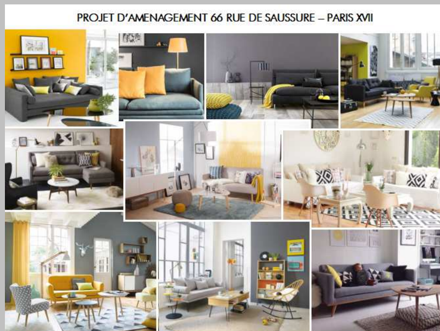
Planche mobilier :